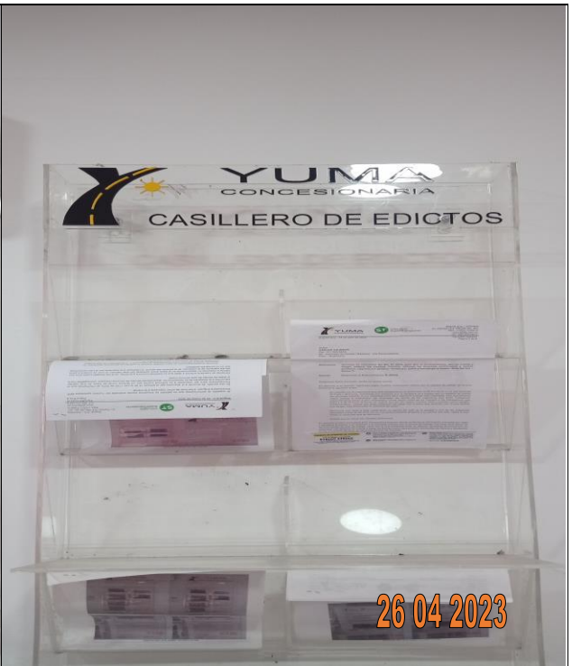
EDICTO R_36995 YC-CRT-126345