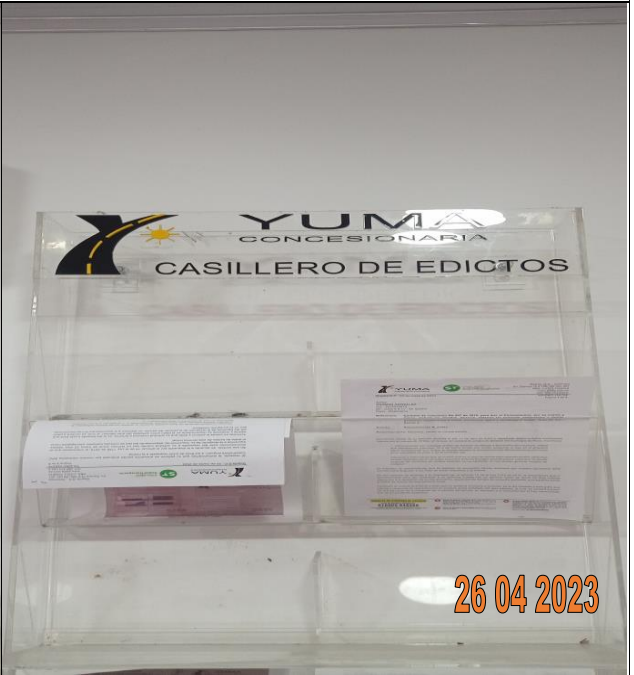
EDICTO R_36995 YC-CRT-126345